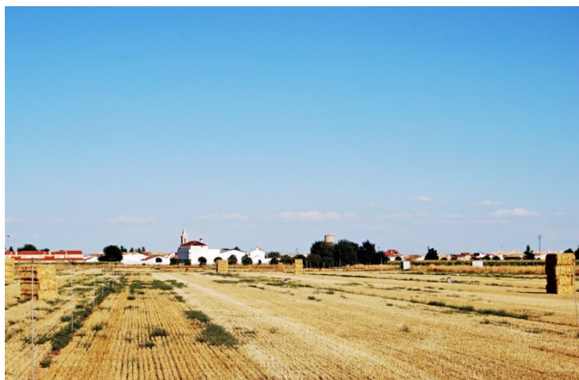
Figura 11. Paisaje de la llanura, La Herrera.