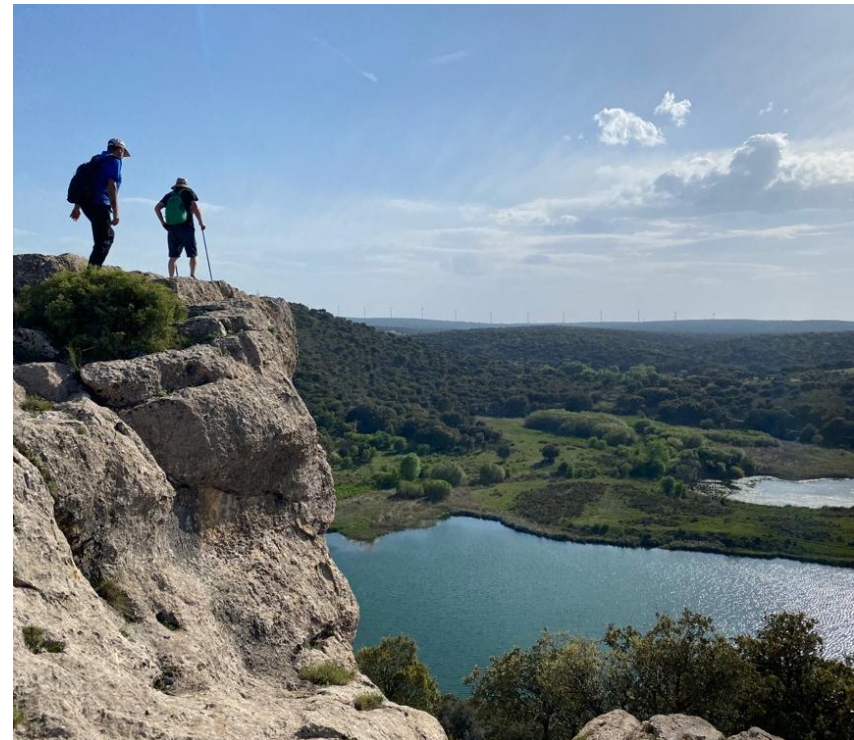
Figura 10. Laguna del Arquillo, Masegoso.

Este eje garantiza que nadie quede atrás en el proceso de revitalización rural, fomentando la cohesión social y territorial. Logrando que las comunidades rurales sean vivas, diversas y articuladas.