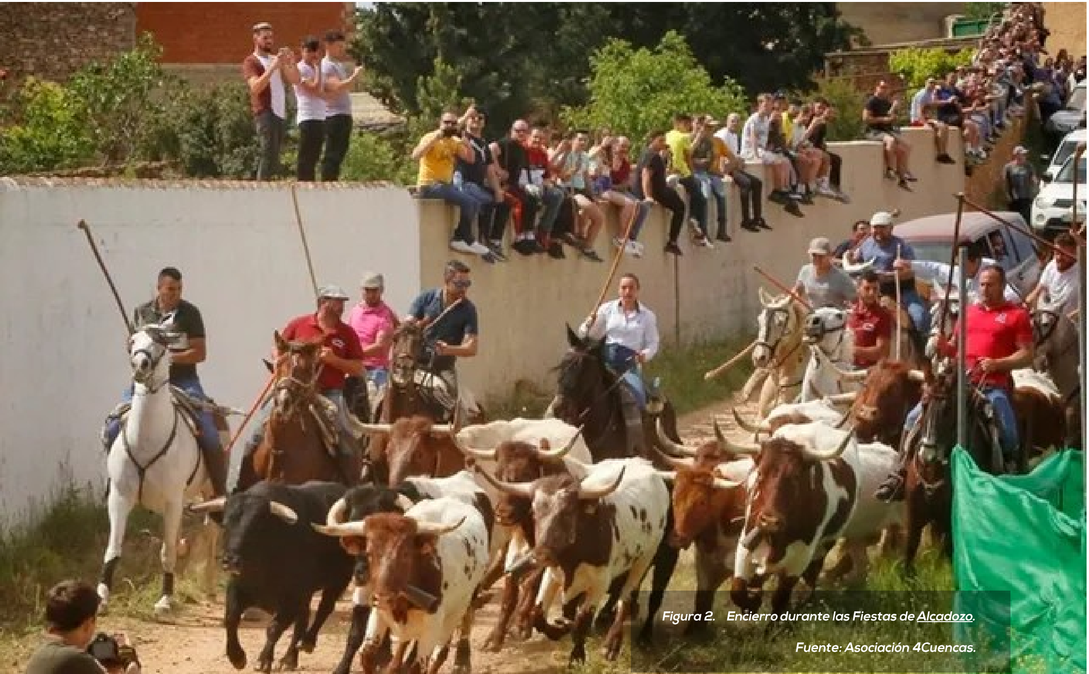
Figura 2. Encierro durante las Fiestas de Alcazo.