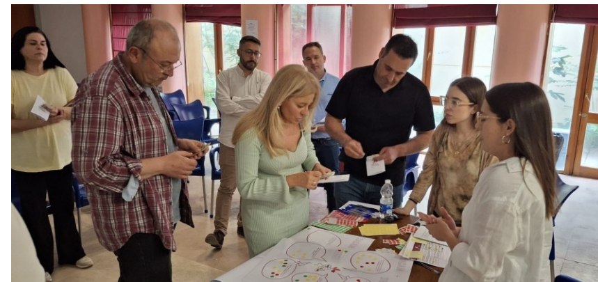
Figura 4. Imagen de una de las Mesas Sectoriales realizadas durante el proceso de participación ciudadana de esta ADUR.

La clave para mejorar el desarrollo de la Comarca está en combinar innovación, sostenibilidad y participación , con políticas adaptadas al medio rural y una gobernanza colaborativa que empodere a los municipios.