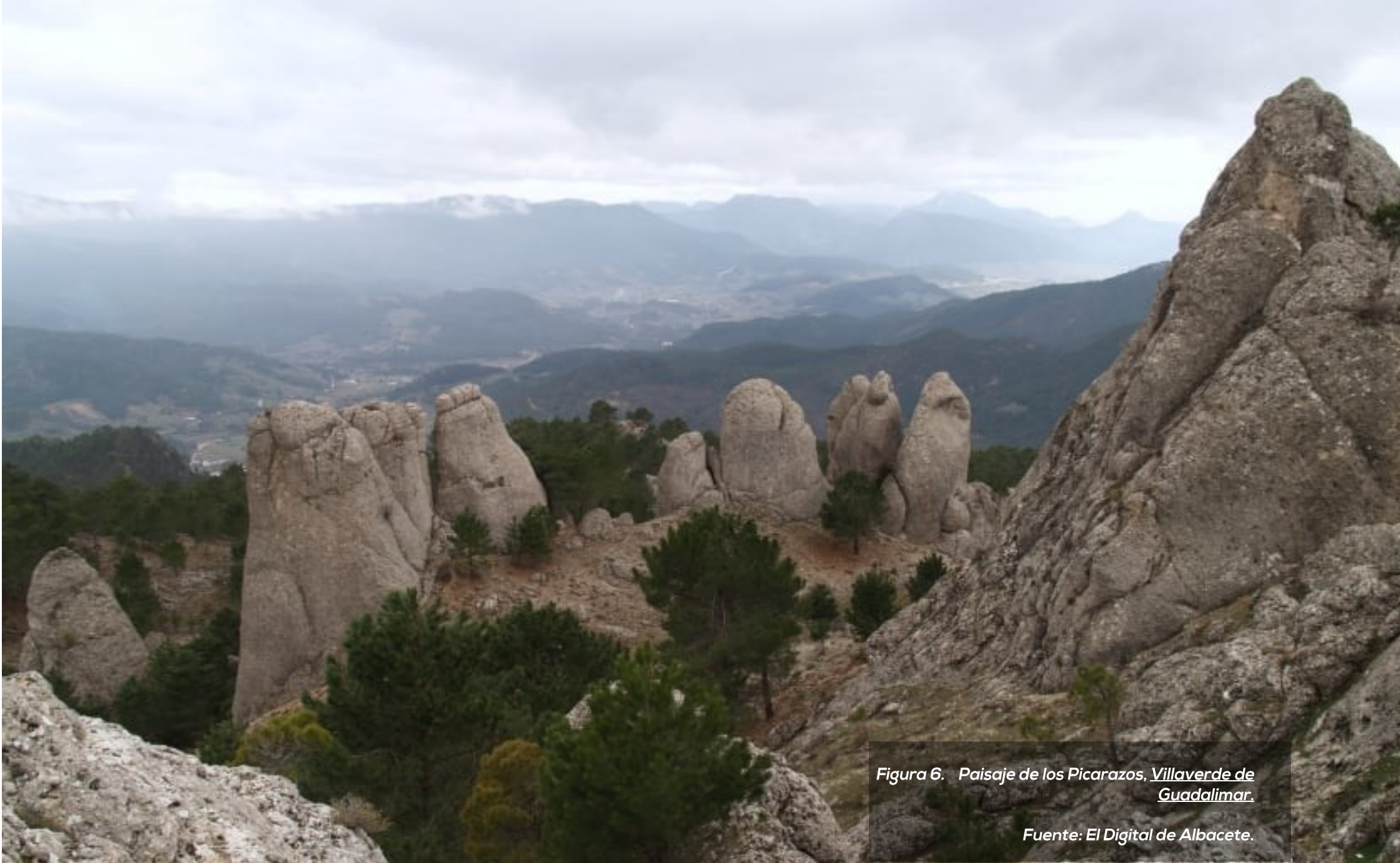
Figura 6. Paisaje de los Picarazos, Villaverde de Guadalimar .