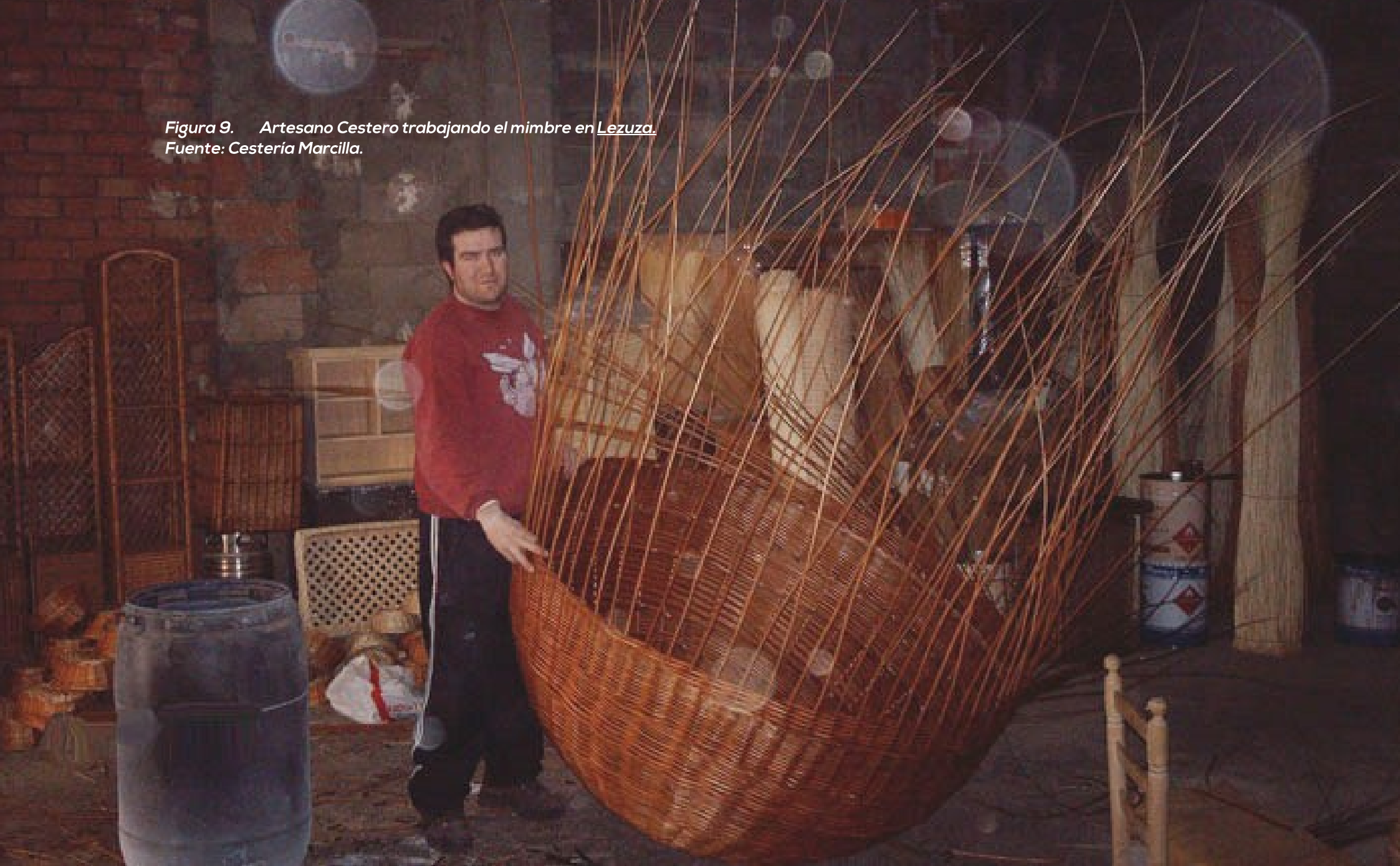
Figura 9. Artesano Cestero trabajando el mimbre en Lezuza .