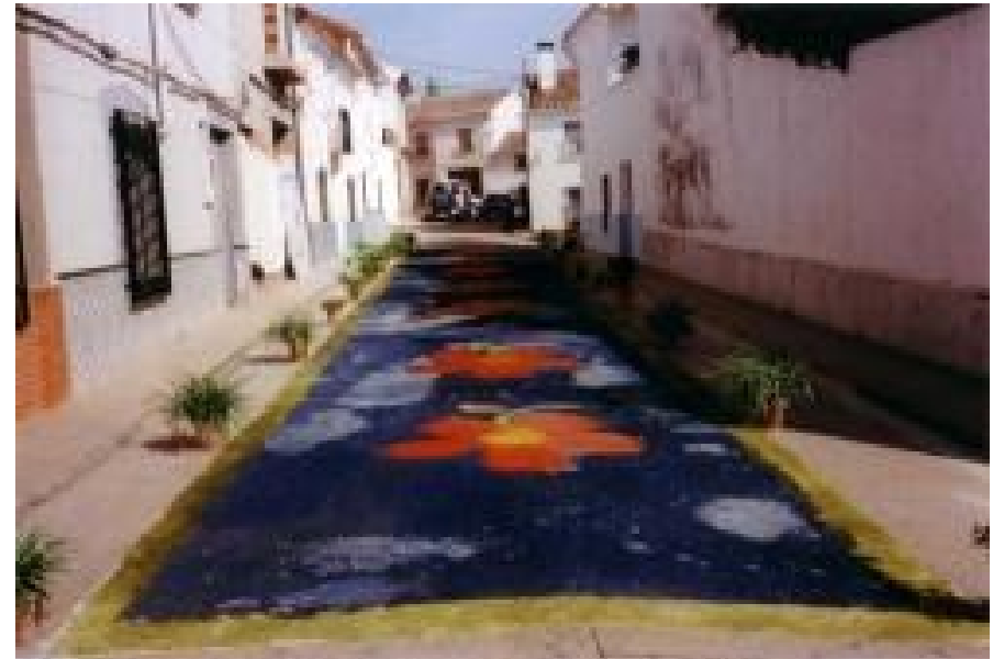
Figura 8. Alfombras de flores en las fiestas del Corpus Cristi de Povedilla.