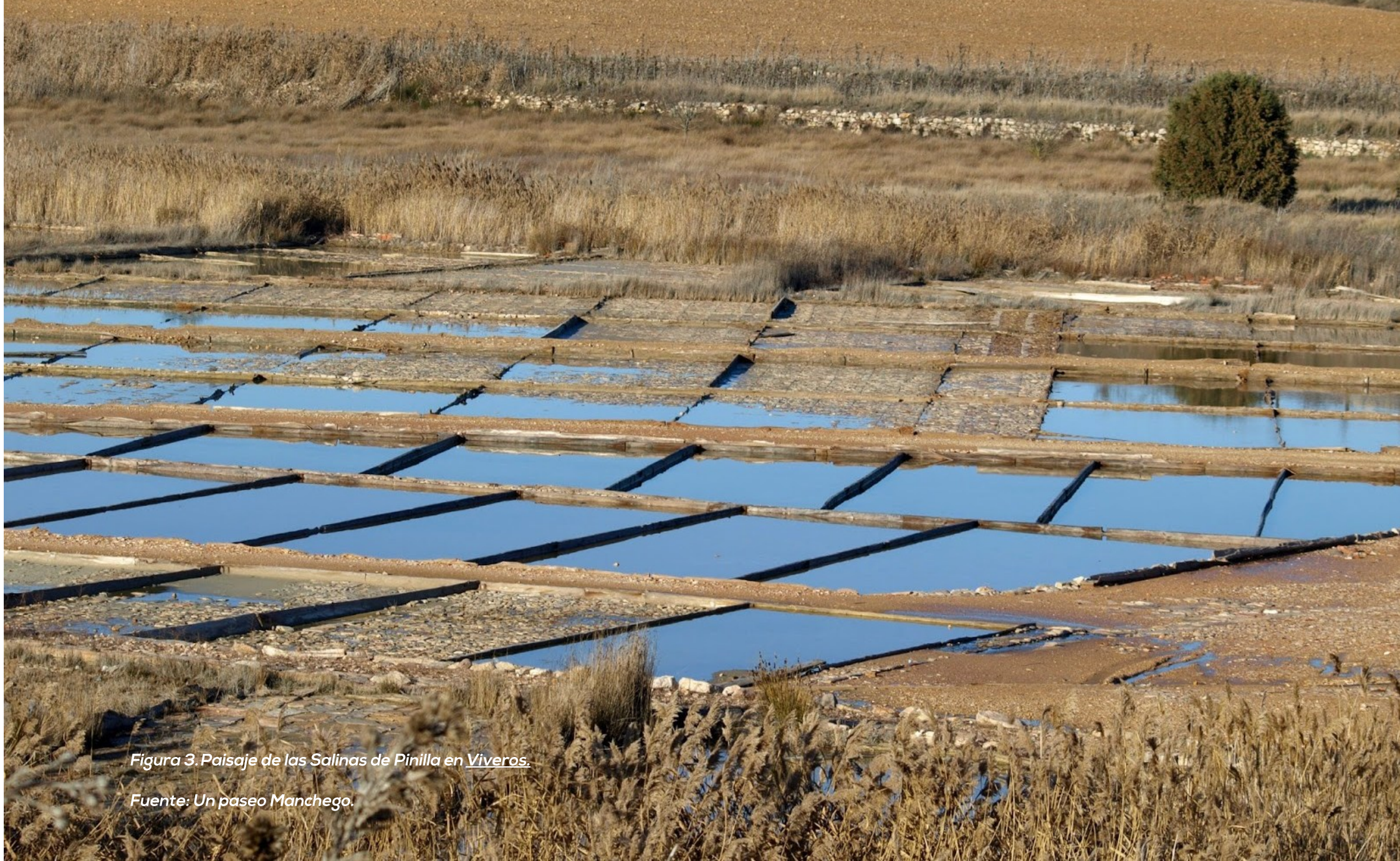
Figura 3. Paisaje de las Salinas de Pinilla en Viveros .