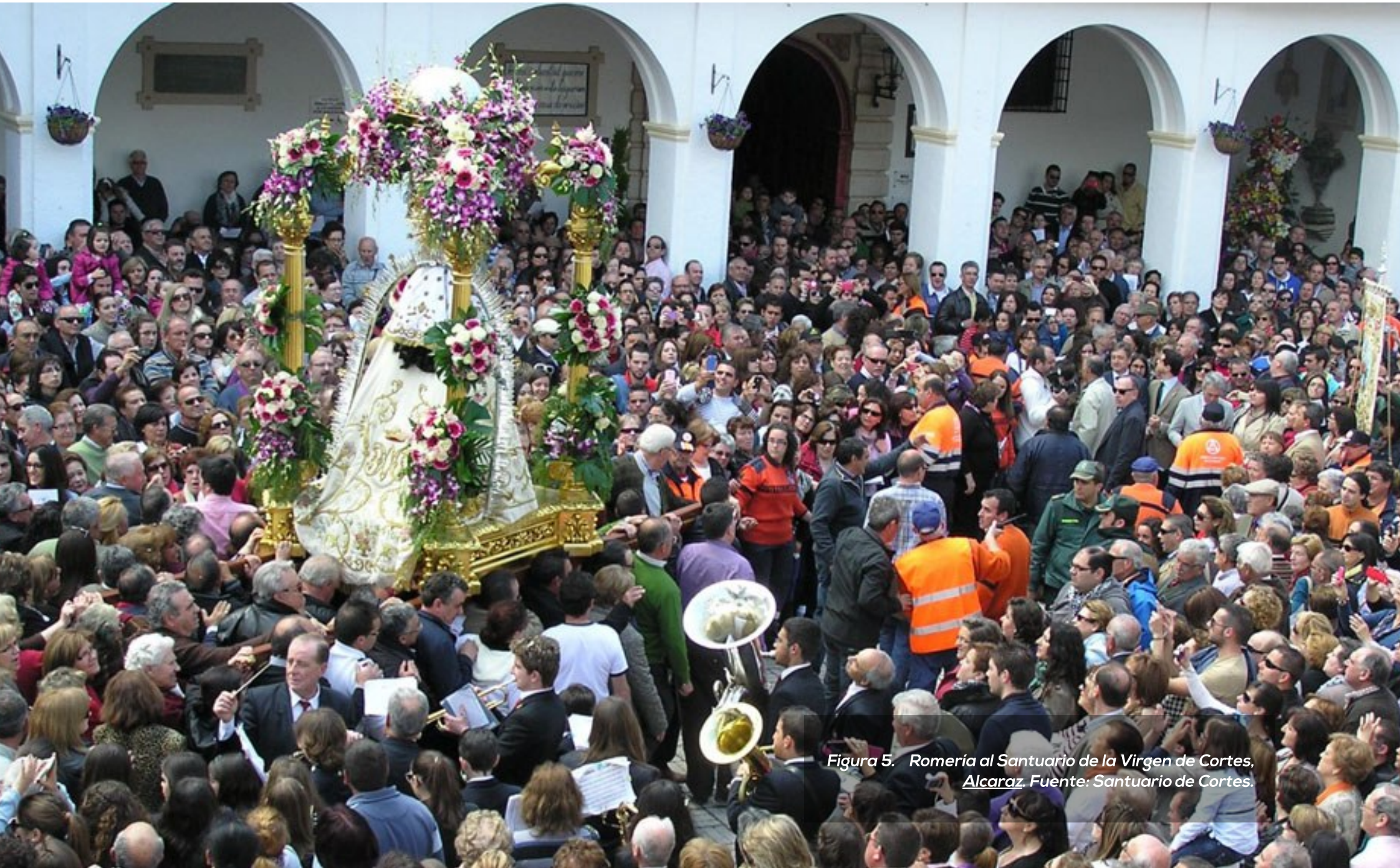
Figura 5. Romería al Santuario de la Virgen de Cortes, Alcaraz.