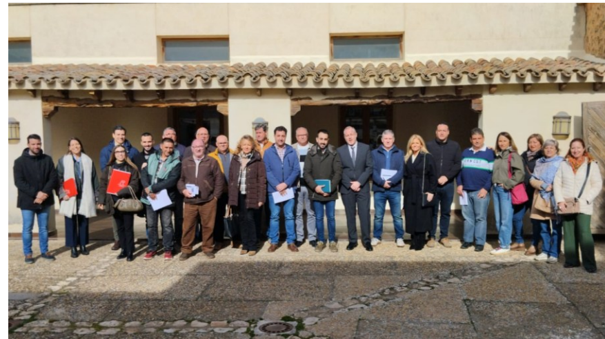
Figura 5. Imagen de la reunión de trabajo con el Viceconsejero de Planificación Estratégica, el Grupo de Desarrollo Rural y los alcaldes de SACAM. Llevada a cabo durante el proceso de participación ciudadana de esta ADUR.

En resumen, la gobernanza en la comarca SACAM se enfrenta a importantes desafíos estructurales, normativos y sociales, pero también cuenta con activos institucionales y oportunidades estratégicas que pueden ser aprovechadas para construir un modelo de desarrollo más cohesionado, participativo y sostenible. La mejora de los instrumentos de planificación, la creación de estructuras comarcales de coordinación, la adaptación normativa al medio rural y el fortalecimiento de la participación ciudadana son elementos clave para avanzar en esta dirección.