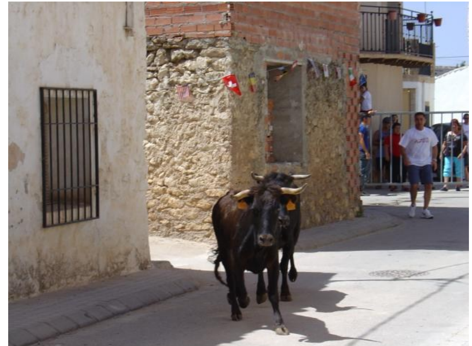
Figura 3. Encierro durante las Fiestas de Vianos. Fuente: Verpueblos).

Sensibilización y divulgación de los recursos naturales de la comarca y su importancia en el desarrollo comarcal