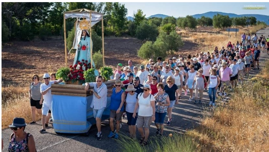
Figura 14. Romería a la Virgen del Turruchel en Bienservida.

El Plan Estratégico de la PAC busca alcanzar los objetivos de la PAC y la ambición del Pacto Verde Europeo , basadas en un análisis minucioso de las necesidades (diagnóstico, identificación y priorización) del sector agrario y el medio rural en su conjunto, vinculadas a cada uno de los objetivos de la PAC.