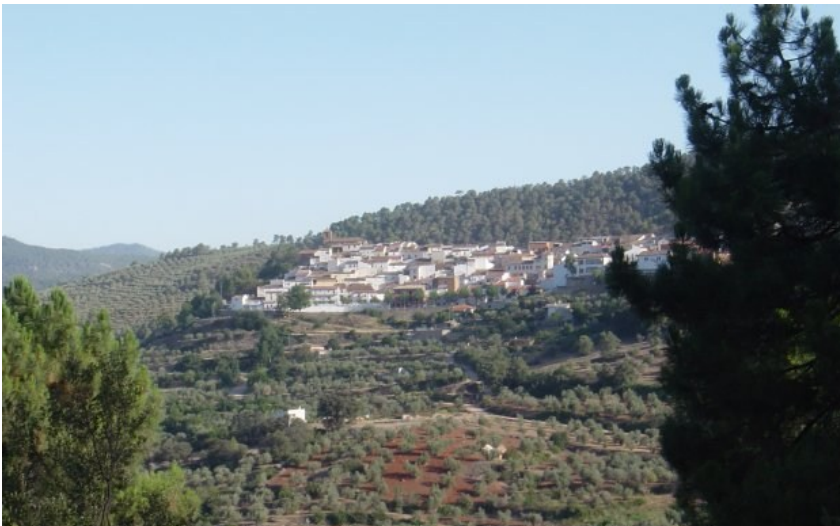
Figura 9. Vista del Paisaje en Cotillas.