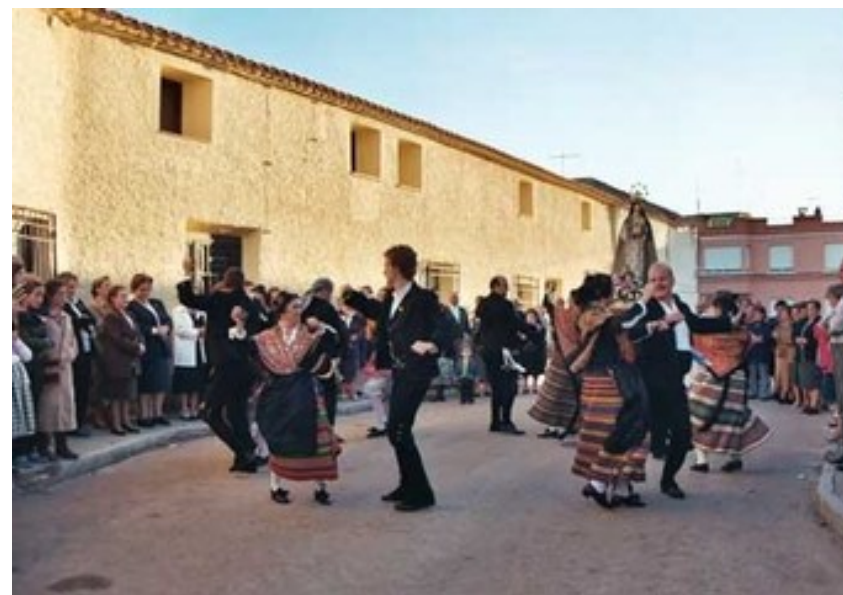
Figura 12. Manchegas durante las Fiestas de Pozuelo. Fuente: ayuntamiento.