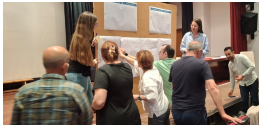
Figura 3. Imagen de una de las Mesas Sectoriales realizadas durante el proceso de participación ciudadana de esta ADUR.