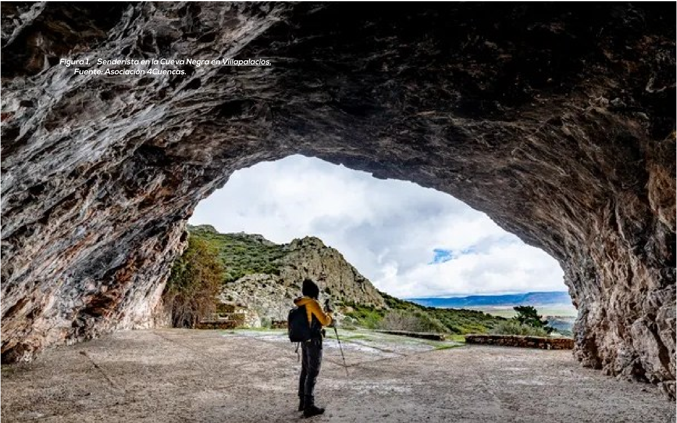
Figura 1. Senderista en la Cueva Negra en Villapalacios.