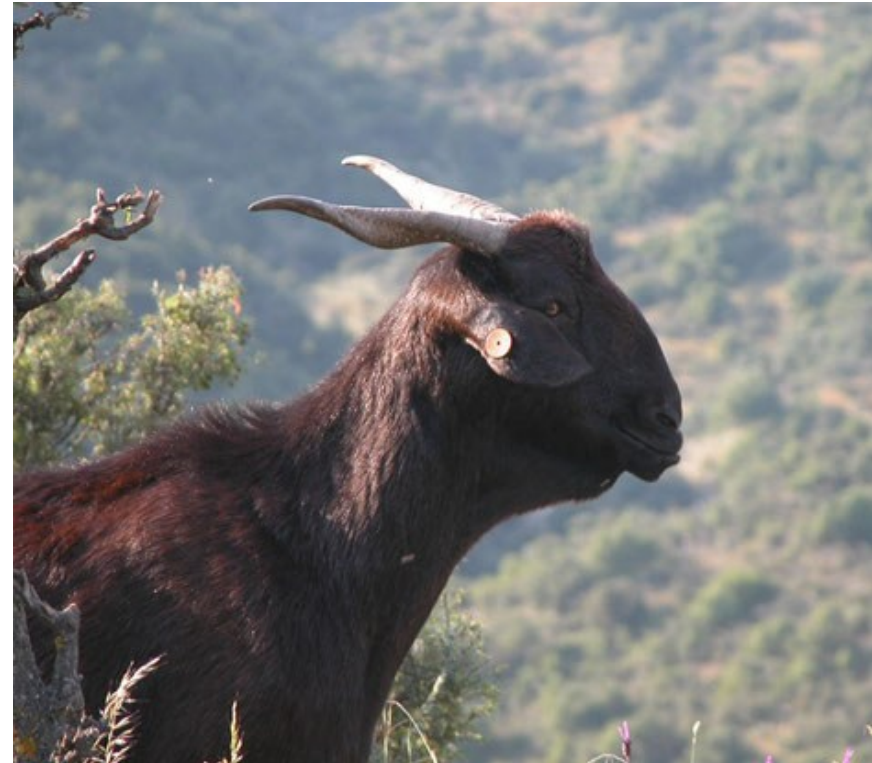
Figura 6. Pastoreo extensivo de la Cabra Negra Serrana, en Peñascosa. Raza ganadera autóctona de la Sierra de Alcaraz y de Sierra Morena en peligro de extinción.

La intención principal es generar un vínculo que favorezca una transición progresiva entre aquellas situaciones y las propuestas por esta ADUR.