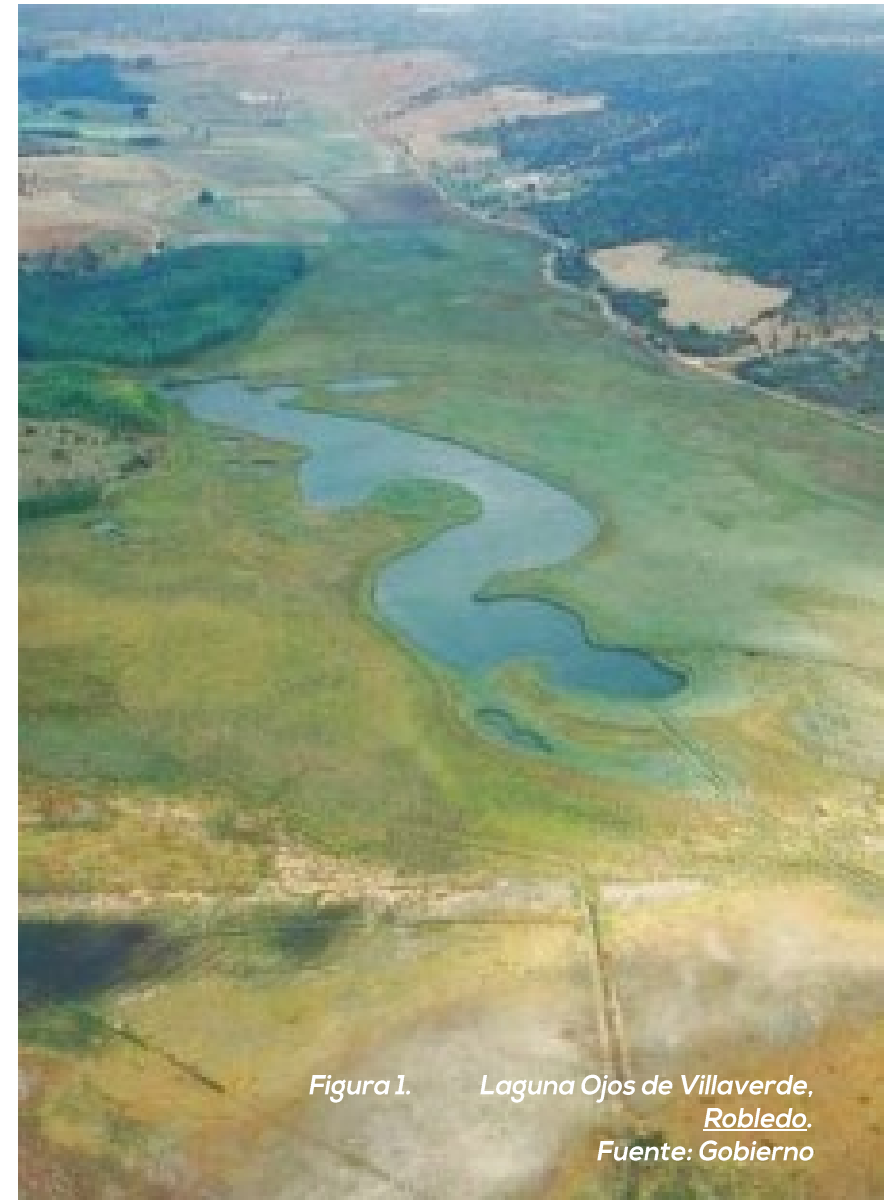
Figura 1. Laguna Ojos de Villaverde, Robledo.