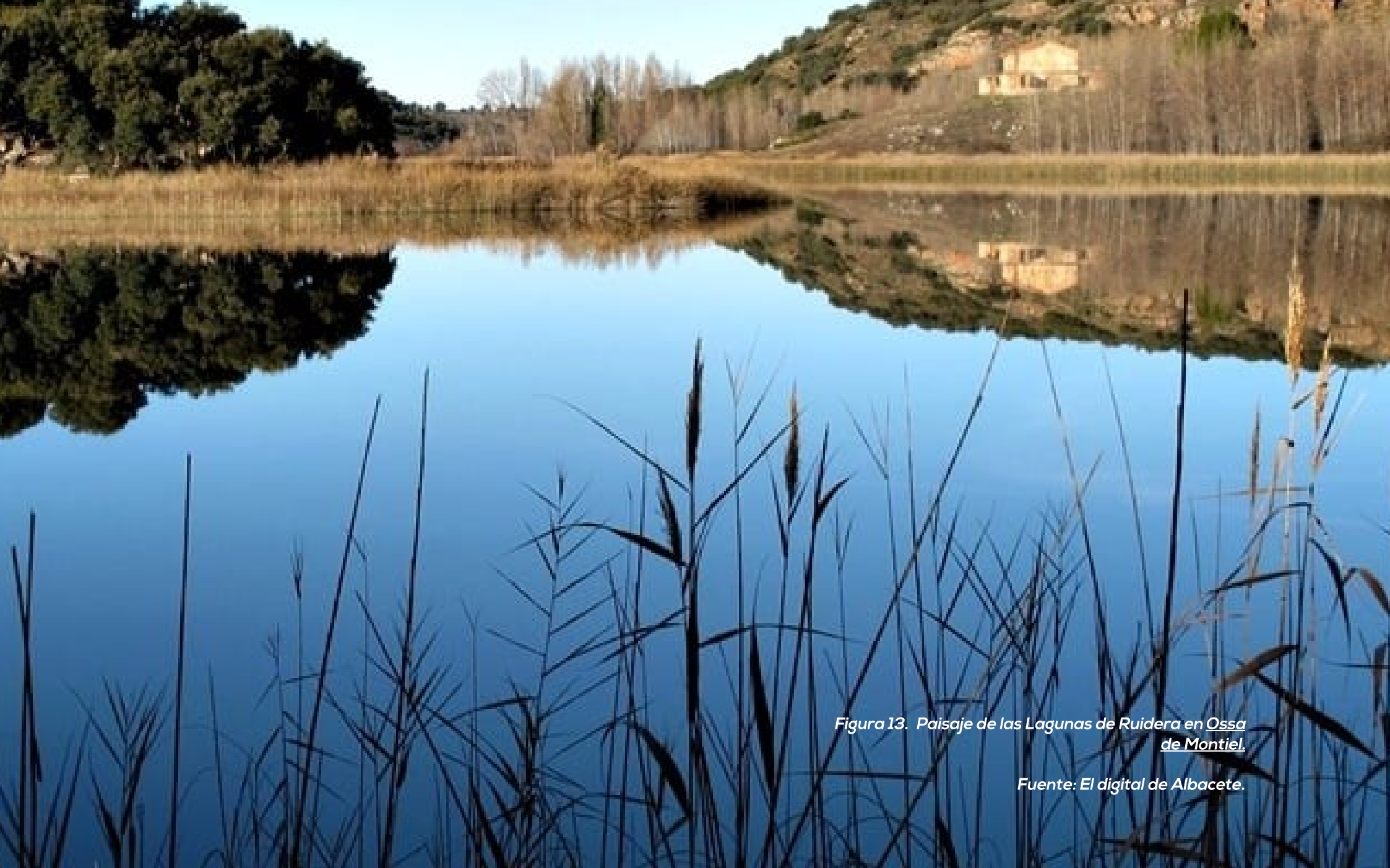
Figura 13. Paisaje de las Lagunas de Ruidera en Ossa de Montiel.