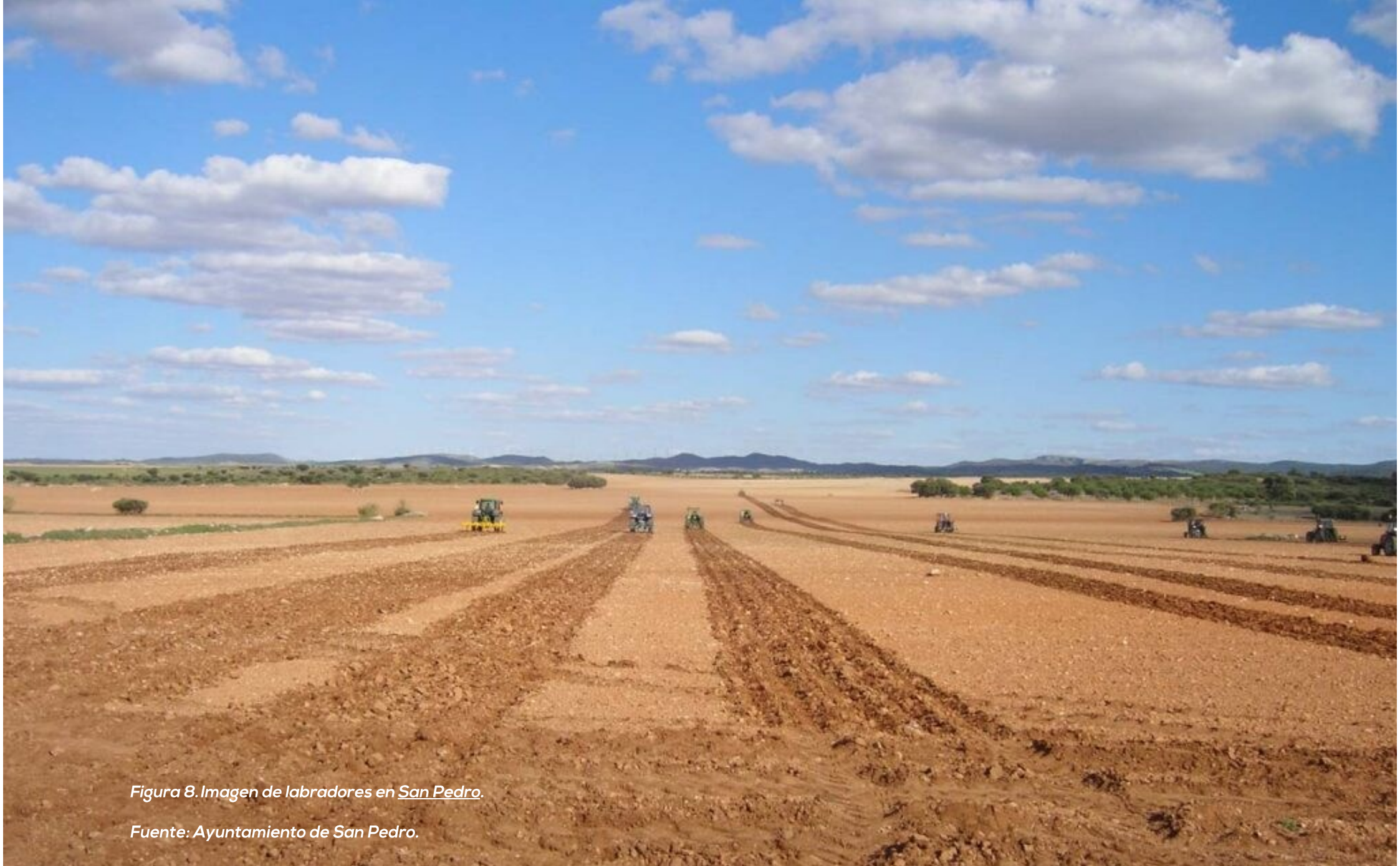
Figura 8. Imagen de labradores en San Pedro.