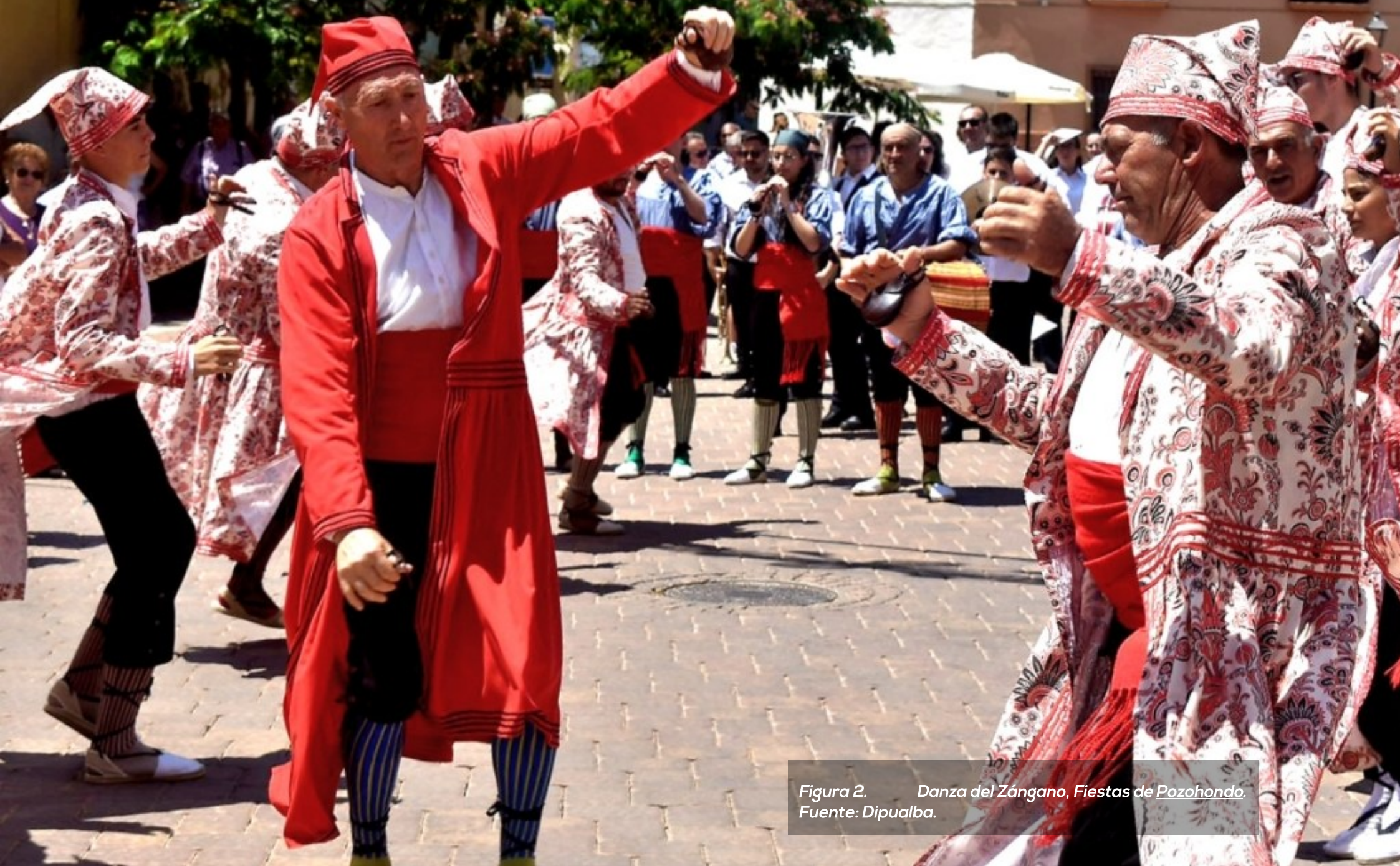
Figura 2. Danza del Zángano, Fiestas de Pozohondo.