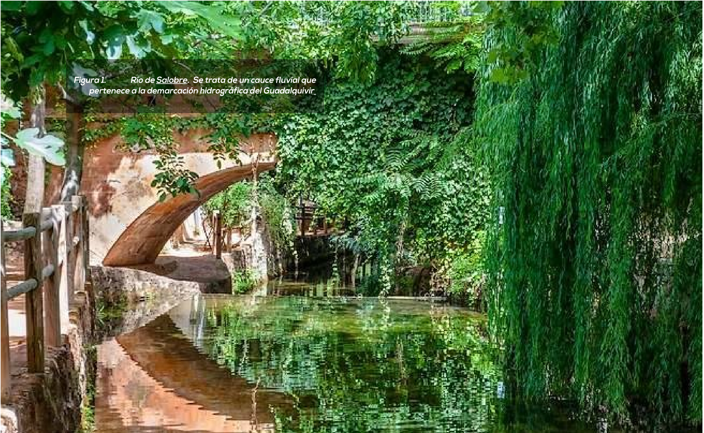
Figura 1. Río de Salobre. Se trata de un cauce fluvial que pertenece a la demarcación hidrográfica del Guadalquivir.