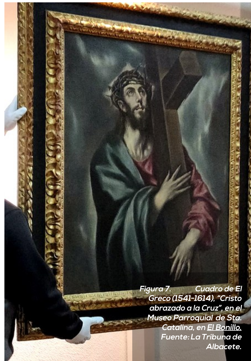
Figura 7. Cuadro de El Greco (1541-1614), "Cristo abrazado a la Cruz", en el Museo Parroquial de Sta. Catalina, en El Bonillo.