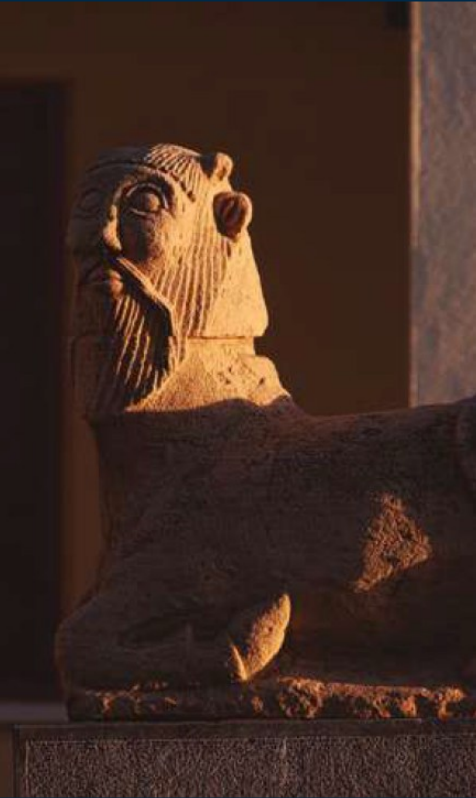
Figura 1. Bicha de Balazote, escultura íbera creada en la Edad de Hierro, entre los siglos VI y V a.C.