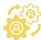
Eje 3. Fortalecimiento del potencial endógeno. Desarrollo económico local