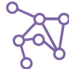
Eje 4. Visión comarcal y cooperación municipal