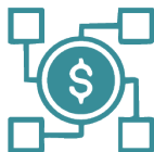
Eje 2. Maximizar el impacto de la financiación europea